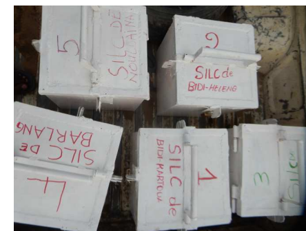
Appui des OP en épargne et crédit

Objectif global: Amélioration des conditions socio-économiques et environnementales des populations des Départements du Logone et Chari, du Mayo Kani et du Mayo Danay.