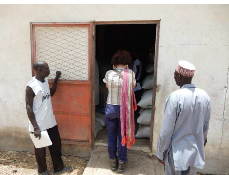
Visite de la banque de céréales de Ker- deng