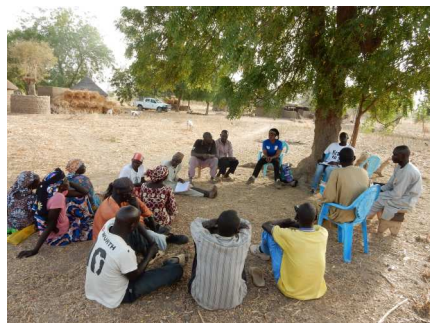
Réunion avec l'Union de GIC Lagapka de Kilguim- Gambour

Le Service de Développement Rural et Agraire, appelé Service Agriculture jusqu'à décembre 2010, est une des branches du CODAS-Caritas de Yagoua qui intervient pour l'amélioration des conditions de vie des ruraux des départements du Logone et Chari, du Mayo Kani et du Mayo Danay. La zone d'intervention a été reconfigurée en pôles et zones d'intervention à plusieurs reprises en fonction des phases de projets et programmes qui se sont suivis. Actuellement, elle est circonscrite en 5 zones: 2 dans le Mayo Danay, 2 dans le Mayo Kani et 1 dans le Logone et Chari. Depuis les années 70, nous œuvrons principalement dans l'accompagnement des populations paysannes pour les amener à une auto-prise en charge durable. Actuellement, il poursuit cet accompagnement en s'appuyant sur les EAF (Exploitations agricoles familiales) qui s'organisent en réseaux de GIC et de Coopératives pour être plus fort contre la pauvreté.